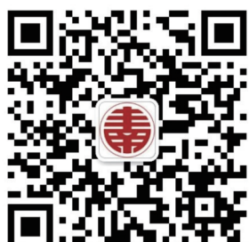
丰南文化驿站微信公众号二维码