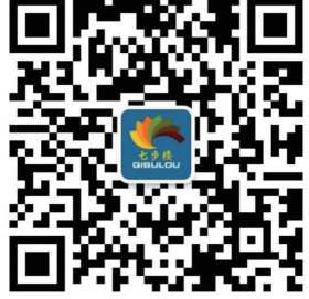
七步楼网站二维码