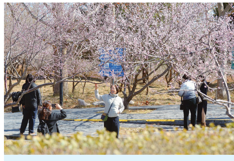
春意渐浓,市区凤凰山公园内繁花盛开,市民纷纷走出家门,踏青赏花、拍照留影,尽享明媚春光中的惬意时光。杜雯拓展