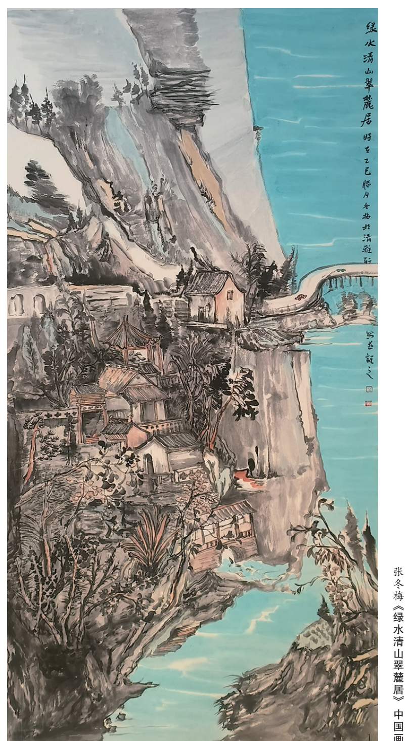
张冬梅《绿水青山翠麓居》中国画