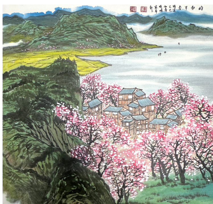
刘晓峰《岭南早春》中国画