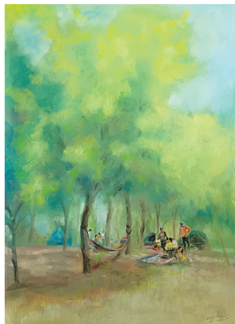
梁贺《南湖春游》色粉画