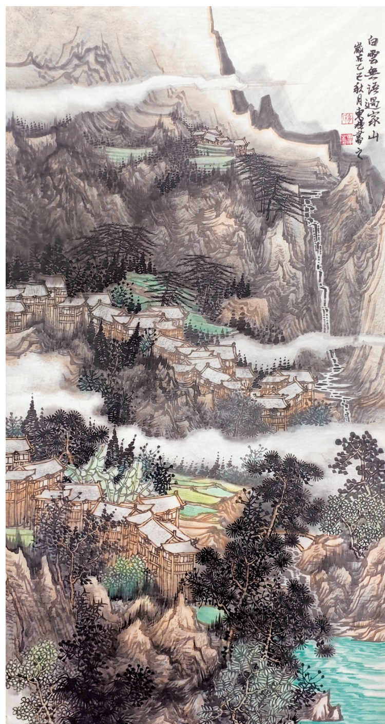
胡东辉《白云无语过家山》中国画