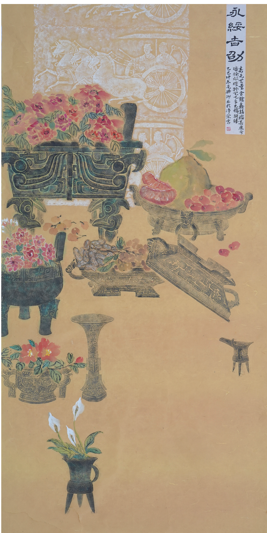
吴兴洲《永绥吉劬》中国画