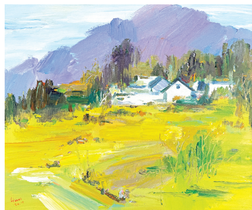
李杰《春日写生》油画