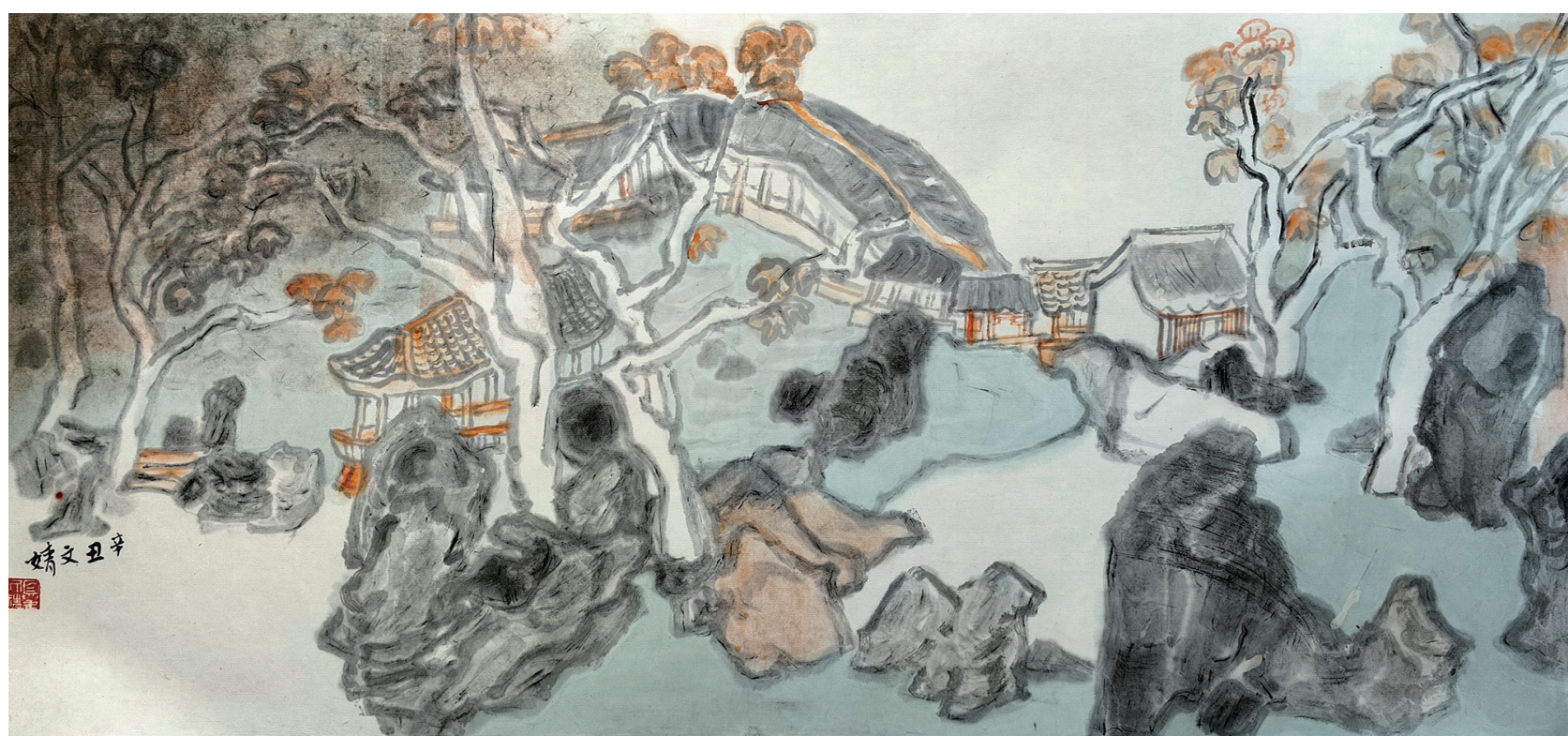
夏文静《庭园悠翠》中国画