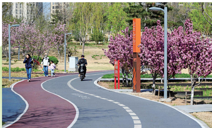
雨栖凤翔公园里,层次丰富的春景将步道装点得生机盎然。