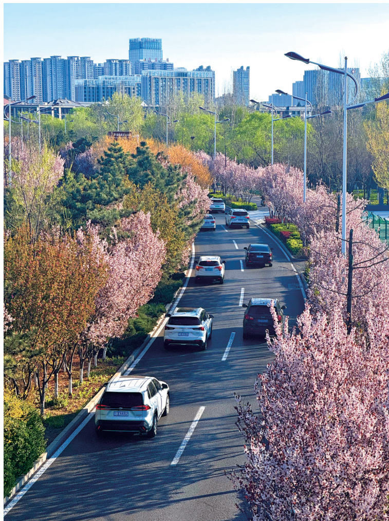
卫国南路车辆穿行花丛间。

春风送暖,繁花满枝。四月的唐山大地,被春日的画笔晕染出最动人的色彩。从陡河河畔玉兰盛放,到街巷海棠飘香,从城市公园游人如织,到街头花影婆娑,整座城市都沉浸在“最美人间四月天”的诗意与生机里,一幅人与自然和谐共生的春日画卷在凤城唐山绘就。