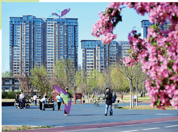
市民走出家门,在春日里嬉戏。