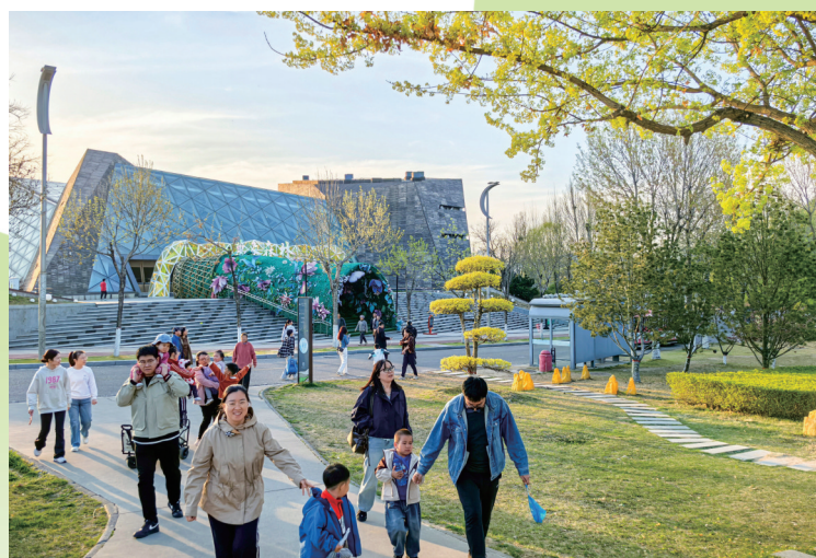
在唐山南湖·开滦旅游景区,市民结伴而行,尽享春日芳华。