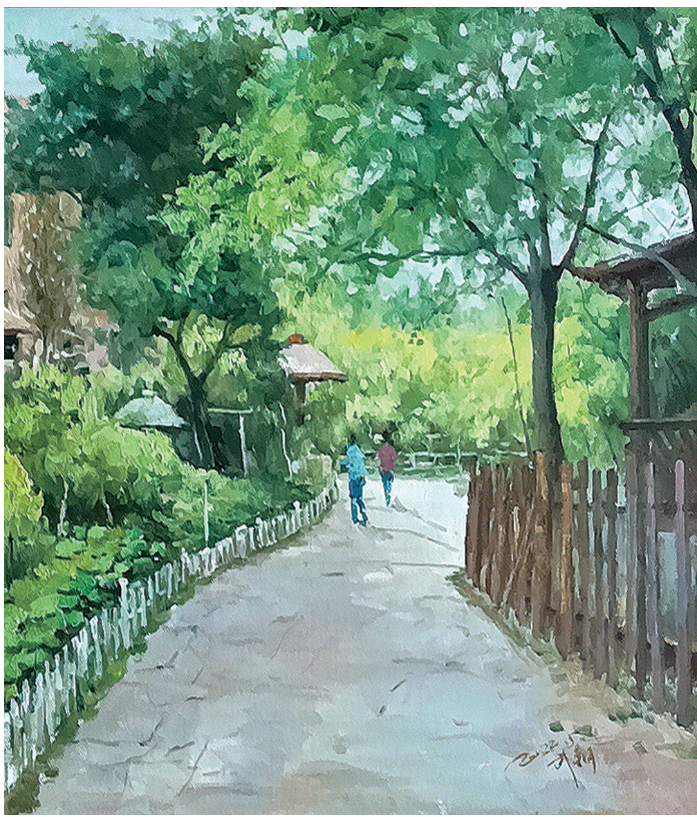
武钢《丽日游园》油画