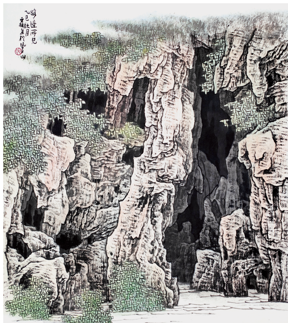
张霖生《路边所见》国画