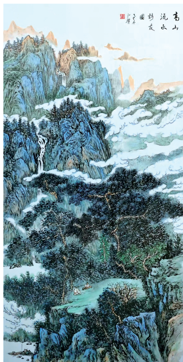
程红璞《高山流水访友图》瓷板画