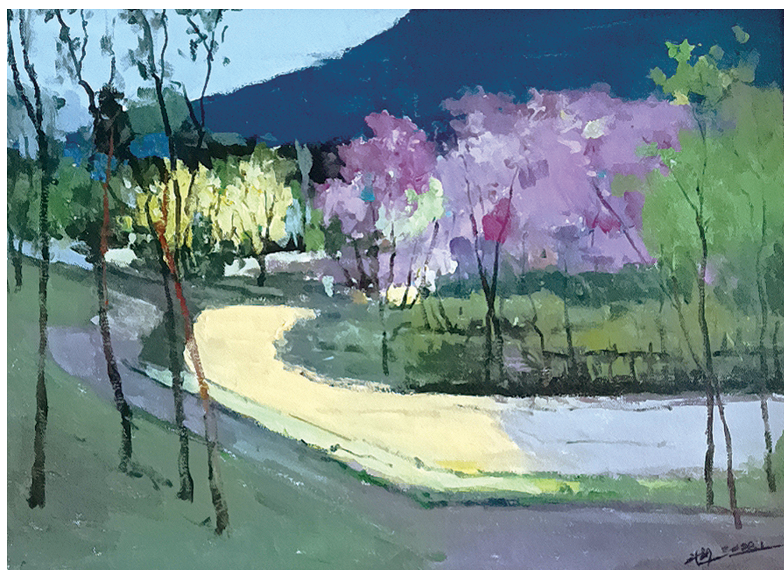
武钢《花开时节》油画