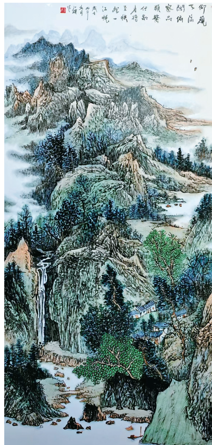
程红璞《春山放棹图》瓷板画