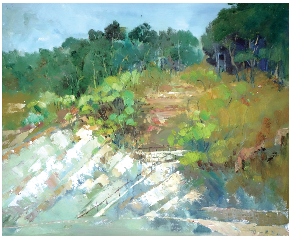
刘岐海《栗林·春》油画