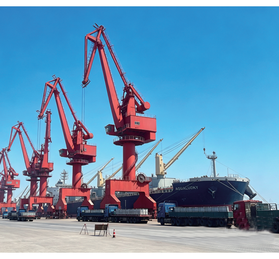
图为作业现场。

河北日报客户端讯(戴玮序、王育民)4月14日下午,载有2.8万吨钢材及24台工程大巴的“忠诚”号轮驶离河钢物流曹妃甸码头,启程前往斯里兰卡科伦坡港。这是河钢物流首次完成多类别高附加值货物拼船作业,也标志着该公司开通斯里兰卡航线。