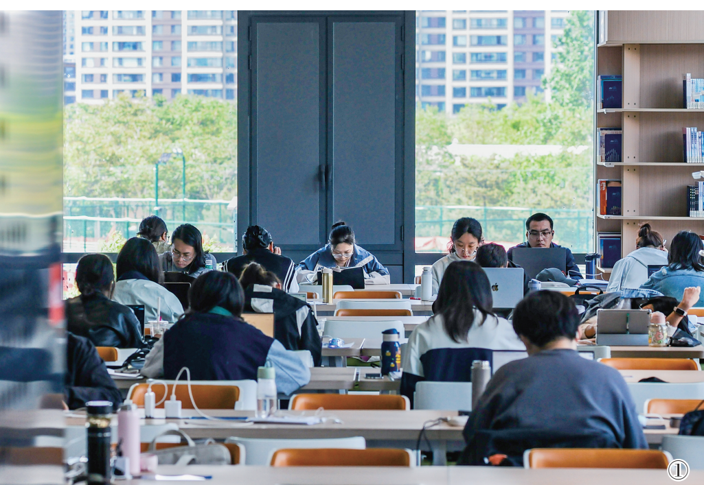
①“五一”假期,路北区图书馆书香萦绕、氛围静谧,不少市民告别出游喧嚣,选择走进图书馆,在笔墨书香中度过充实假期。阅览区内,各年龄段读者静心品读。学子伏案深耕、市民闲阅典籍,家长陪伴孩子亲子共读,轻柔的翻书声缓缓流淌。大家以阅读为乐,在书海里沉淀自我,汲取养分。浓厚的书香气息,尽显全民阅读的文明风尚。

化场馆的区位优势,假期期间客流持续高位,商户生意红火,不少摊位前排起长队。 此次“五一”活动,小南市集以“市集+美食+演艺+互动”的多元模式,不仅激活了假期文旅消费潜力,更擦亮了唐山“烟火文旅”名片。未来,小南市集将持续常态化运营,不定期推出主题市集、民俗活动、惠民演出,打造兼具本土底蕴与潮流活力的城市文旅新地标,让烟火气持续升温、幸福感不断升级。