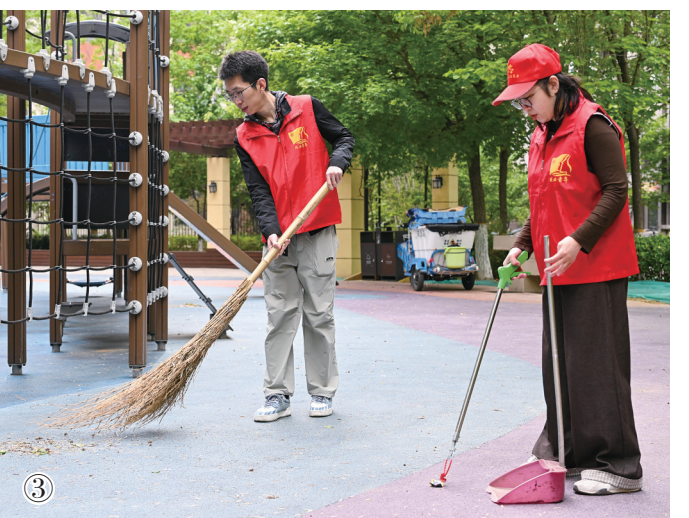
②“五一”假期,皮影乐园“云朵奇遇”主题巡游火热上演,作为园区“云朵糖果节”核心亮点,为亲子游客打造沉浸式云端童话盛宴。图为皮影乐园“云朵奇遇”巡游现场,童话主题的演员们牵着小朋友的手,一同开启梦幻的云端之旅。③“五一”假期,路北区期云道街道金城绿社区的青年志愿者放弃休息,主动投身社区志愿服务,开展洗绿护绿、清扫环境、普及安全知识等活动,用实际行动美化家园、传递温暖,为社区增添了一抹亮丽的志愿红。