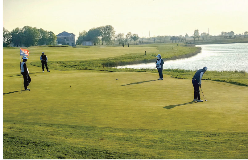
图为比赛现场。

本报讯(记者杨文进)5月1日,2026超级荔枝中国业余高尔夫球冠军赛在我市曹妃甸湿地国际高尔夫俱乐部拉开帷幕。作为国内等级最高的中高协业余一级赛事,本届比赛为期4天,吸引了来自全国各地的156名顶尖业余高尔夫球手齐聚渤海之滨,开启四轮72洞巅峰对决,共同角逐国内业余高尔夫领域的最高荣誉。 本次比赛以高尔夫为媒、赛事为引、生态为魂,是中国一级高尔夫赛事。承办方之一的中国二十二冶集团唐山曹妃甸金熊置业有限公司党支部书记、董事长马健介绍,希望通过举办国家级高规格赛事活动,为广大高尔夫运动员提供优质的交流平台,为中国高尔夫运动培育、储备优秀的后备力量注入新的活力,在未来的国际赛场上为国争光。 唐山曹妃甸湿地国际高尔夫俱乐部作为承办球场,是中高协认证的业余一级赛事球场,同时纳入世界业余选手积分排名(WAGR)体系,赛事规格与竞技水平稳居国内业余高尔夫赛事第一梯队,已成为中国业余高尔夫人才培养的核心平台与职业赛道的重要跳板。 4月30日,2026超级荔枝中国业余高尔夫球冠军赛全体人员大会在曹妃甸国际高尔夫俱乐部举行。曹妃甸湿地国际高尔夫俱乐部、超级荔枝(上海)体育文化发展有限公司、北京凯奥体育俱乐部三家单位举行了签约仪式,以及超级荔枝中国业余高尔夫球冠军赛指定场地揭牌仪式,三方将携手为中国业余高尔夫球手提供更加优质的赛事和训练服务。