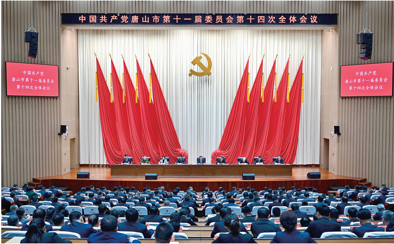
5月12日,中国共产党唐山市第十一届委员会第十四次全体会议在市委党校举行。

全会强调,要坚定不移以新发展理念引领高质量发展,凝心聚力推动“十五五”开好局起好步。要坚持服务大局,积极承接北京非首都功能疏解,大力引进央企二三级子公司,用好京津支撑条件,深化“京津研发、唐山转化”,持续加强与京津文旅合作,在推进京津冀协同发展中更好发展自己。全力支持服务雄安新区高质量建设和发展,常态化对接雄安未来之城场景,主动服务雄安进出口业务,为建设新时代创新高地和推动高质量发展样板贡献唐山力量。要坚持创新引领,建好用好燕赵钢铁实验室,推