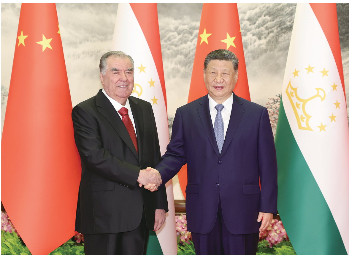
五月十二日下午,国家主席习近平在北京人民大会堂同来华进行国事访问的塔吉克斯坦总统拉赫蒙举行会谈。