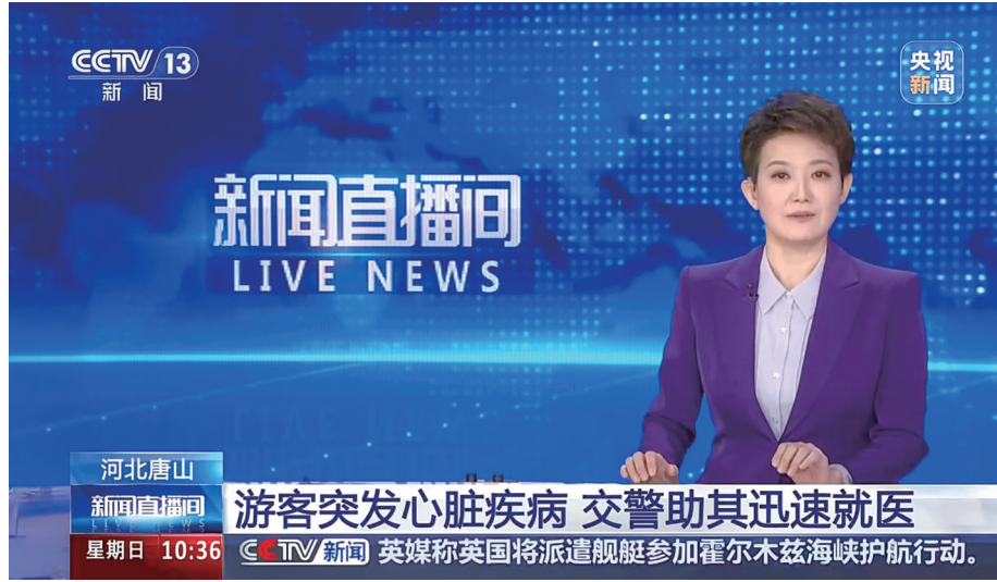
“五一”假期期间,一名外地游客在唐山旅游时突发心脏疾病,需要从长深高速前往唐山工人医院。唐山交警接警后,迅速集结警力,原本30分钟路程仅用8分钟就将患者护送入院,为患者救治赢得了宝贵时间。央视《新闻直播间》《晚间新闻》、央视新闻客户端先后对此进行了报道,弘扬正能量,彰显唐山城市温度。