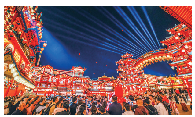
▲5月4日,人民网客户端刊发《河北唐山:河头老街景区灯火璀璨》视频新闻,介绍“五一”小长假期间,河北省唐山市丰南区河头老街景区灯火璀璨、游人如织,热闹非凡。人们看演出、赏美景、品美食,乐享假日时光。

5月9日,人民网刊发《2026年全国春季“村晚”示范展示点活动在唐山市路南区举办》消息,介绍2026年全国春季“村晚”示范展示点活动在唐山市路南区稻地镇桥东村举办,草原风情相遇稻乡风韵,文旅交融赋能乡村振兴。本次活动以“融合·共享·振兴”为主线,依托稻地镇乡村振兴丰硕成果,着力打造“草原-城市-乡村”三位一体特色文旅IP。活动突出群众主角地位,内容丰富、乡情浓郁。本地文艺骨干、网红主播、村民纷纷登台,以乡土表达讴歌稻地新貌;来自内蒙古的文艺工作者则献上雄浑苍劲的呼麦、高亢辽远的长调,共同描绘冀蒙文化交融的生动画卷。除主体演出外,现场还以互动体验、成果展示等形式,打造“观、玩、购、学、感”一站式文旅体验。村民、市民与游客在沉浸式体验中,共享文化交融的独特魅力,实现了“文化有温度、振兴有力度、交流有深度、体验有热度”。活动期间,还召开了冀蒙两地文旅系统融合发展座谈会,双方搭建合作平台,互推资源、链接线路、共享活动,并签署战略合作协议,为两地文旅协同注入新动力。