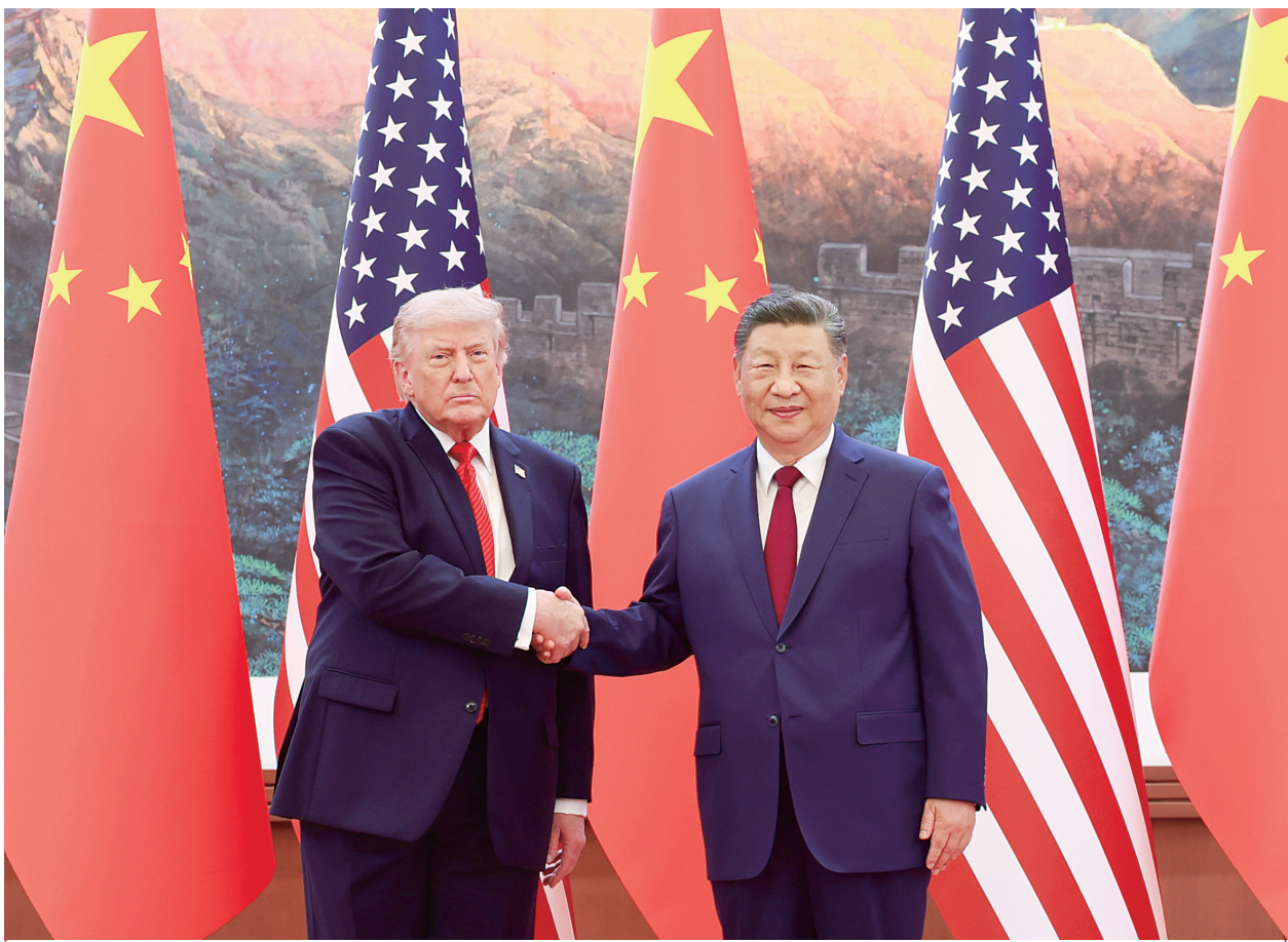
5月14日上午,国家主席习近平在北京人民大会堂同来华进行国事访问的美国总统特朗普举行会谈。

将构建“中美建设性战略稳定关系”作为中美关系新定位 让2026年成为中美关系继往开来的历史性、标志性年份