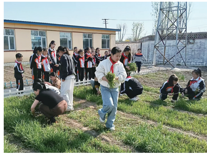
图为同学们积极参加割韭菜比赛。

本报讯(记者闫倩 通讯员肖丹阳)近日,乐亭县汤家河镇中心小学的劳动实践基地里,割韭菜比赛哨声刚落,择韭菜比赛哨声又起,孩子们在劳动中体会“一粥一饭当思来之不易”的深意。