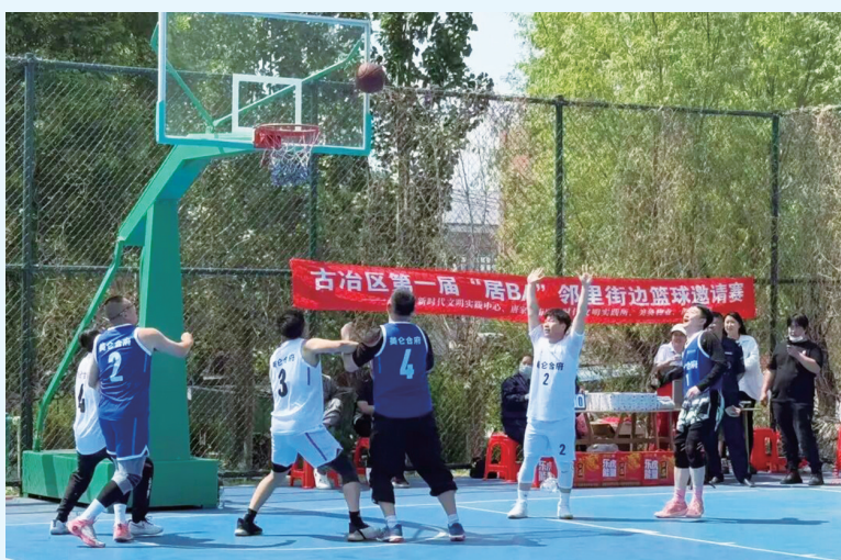
图为“居BA”邻里街边篮球邀请赛比赛现场。

此次赛事的成功举办给篮球爱好者搭建了交流展示的平台,更丰富了基层群众文化生活,拉近了邻里关系,让全民健身氛围更浓厚。